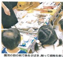
園児の目の前で魚をさばき、触って感触を楽しんだり、においをかいだりする教室の様子

嫌いなもの食べる効果も... 園児の目の前で魚をさばき、触って感触を楽しんだり、においをかいだりする教室の様子