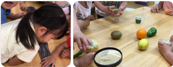
保育園での「味の教室」より