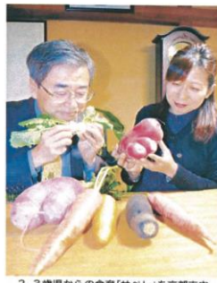
2、3歳児からの食育「サペレ」を京都市内で広める管理栄養士の2人(京都市北区)